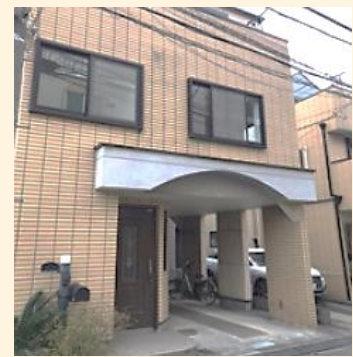
中野新橋ケアラーテラス